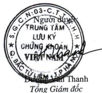
Đã kiểm tra và đồng ý Tông Giám đốc

Các thuyết minh đính kèm là bộ phận hợp thành của báo cáo tài chính này